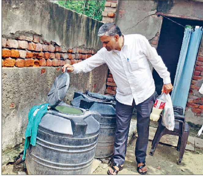
रेवाड़ी। पीएचसी जाटुसना के गांव में पानी की टंकी में लार्वा की जांच करता स्वास्थ्यकर्मी व जाटुसना के गांव में नाली में दवा डालता स्वास्थ्यकर्मी व मिट्टी के बर्तन में लार्वा की जांच करता स्वास्थ्यकर्मी।

बरसात शुरू होने के बाद जिले में डेंगू व मलेरिया का खतरा बढ़ने लगा है। जिले में अभी तक 14 डेंगू पाँजिटिव व 7 मलेरिया के केस मिल चुके हैं, हालांकि ये मरीज स्वस्थ हो चुके हैं, लेकिन मौसम के बदलाव से सरकारी व निजी अस्पतालों में ओपीडी लगातार बढ़ रही है। आगामी दिनों में स्वास्थ्य विभाग के सामने अब सबसे बड़ी चुनौती मलेरिया और डेंगू से निपटने की रहेगी, जिसके लिए स्वास्थ्य विभाग की ओर से पहले से ही सोर्स रिडक्शन का कार्य किया जा रहा है। गत वर्ष फोगिंग में ढील बरतने के कारण जिले में डेंगू के केसों की संख्या काफी बढ़ गई थी। इस बार स्वास्थ्य विभाग को फोगिंग पर विशेष ध्यान देने की जरूरत है। स्वास्थ्य विभाग की ओर से जुलाई माह को डेंगू रोधी माह के रूप में