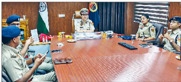
रेवाड़ी। साउथ रेंज के पुलिस अधीक्षकों की बैठक लेती आईजी नाजनीन भसीन।

आईजी नाजनीन भसीन 2007 बैच की पुलिस अधिकारी हैं। उनके पास आरटीसी थोडसी गुरुग्राम का अतिरिक्त कार्यभार भी है। इससे पहले नाजनीन भसीन आईजी स्टेड क्राइम ब्यूरो पंचकूला, पुलिस