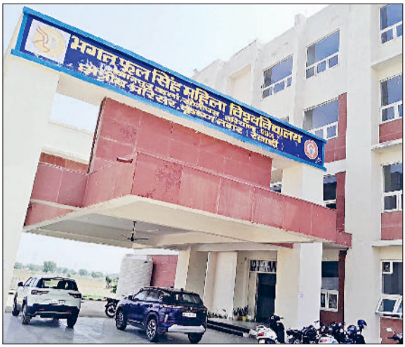
रेवाड़ी। कृष्ण नगर स्थित महिला रीजनल सेंटर।

भगत फूल सिंह महिला विश्वविद्यालय के कृष्ण नगर गांव स्थित रीजनल सेंटर में शुक्रवार को यूजी कोर्सों में दाखिले के लिए प्रथम मेरिट सूची जारी कर दी गई। सूची में उन छात्राओं के नाम शामिल हैं, जिन्होंने ऑनलाइन आवेदन किया था और छात्राएं मेरिट के आधार पर दाखिले के लिए चुनी गई हैं। बीए ऑनर्स मल्टिडिसिप्लिनरी की प्रथम मेरिट सूची में ऑल इंडिया ओपन में 84.40 प्रतिशत तक अंक प्राप्त करने वाली छात्राओं के नाम शामिल हैं तथा हरियाणा में 67.80