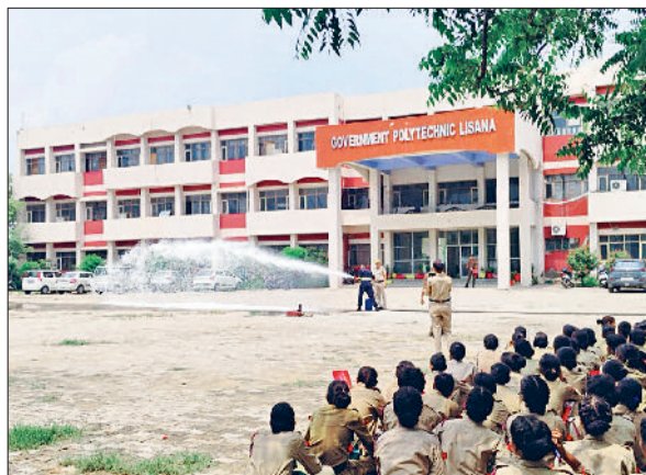
रेवाड़ी। शिविर में आगे बुझाने का प्रशिक्षण लेते एनसीसी कैडेट्स।

राष्ट्रभक्ति सिखाती है, बल्कि एक जिम्मेदार नागरिक के रूप में