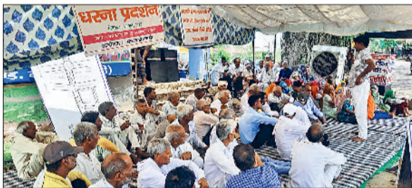
रेवाड़ी। रामगढ़ भगवानपुर में धरने पर बैठे ग्रामीण।